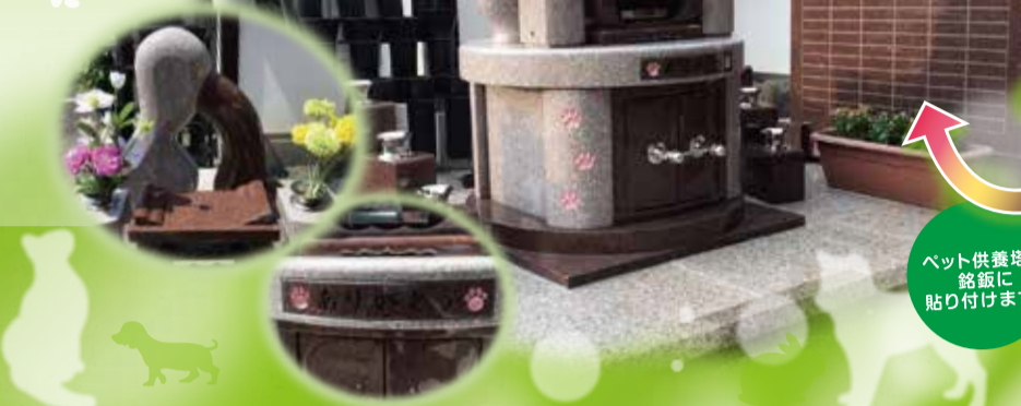
ペット供養塔の 銘板に 貼り付けます。