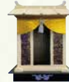
②屋形(折りたたみ式) ¥13,200