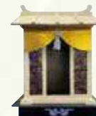
②屋形(折りたたみ式) ¥13,200