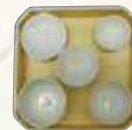
⑥お膳セット白 ¥1,540 ⑦折敷 6寸 ¥2,200