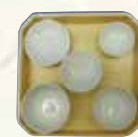
⑥お膳セット白 ¥1,540 ⑦折敷 6寸 ¥2,200