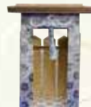
①屋形 銀小 ¥5,900