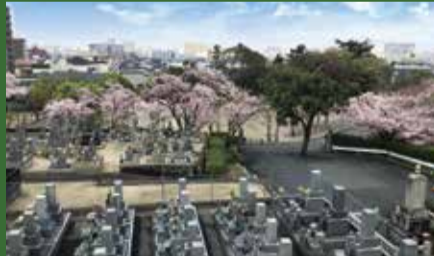
全区画南向き背中合せなし