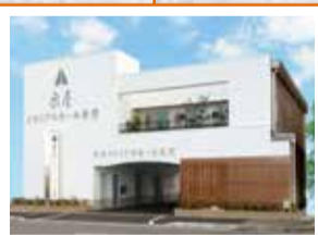
泉屋メモリアルホール香里